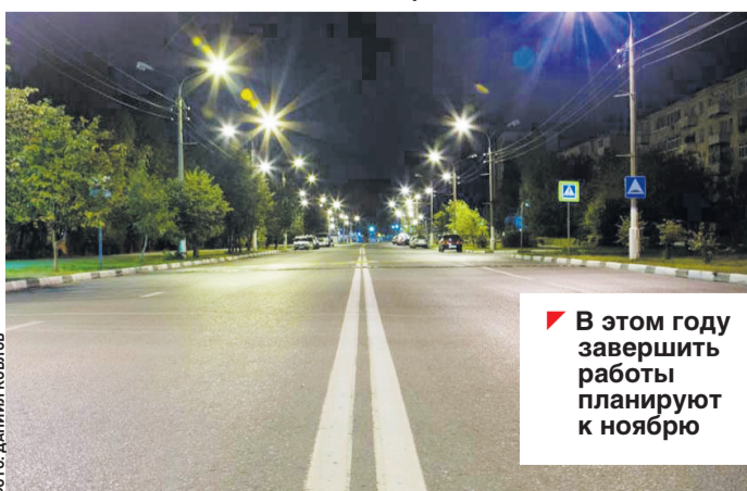
В этом году завершить работы планируют к ноябрю