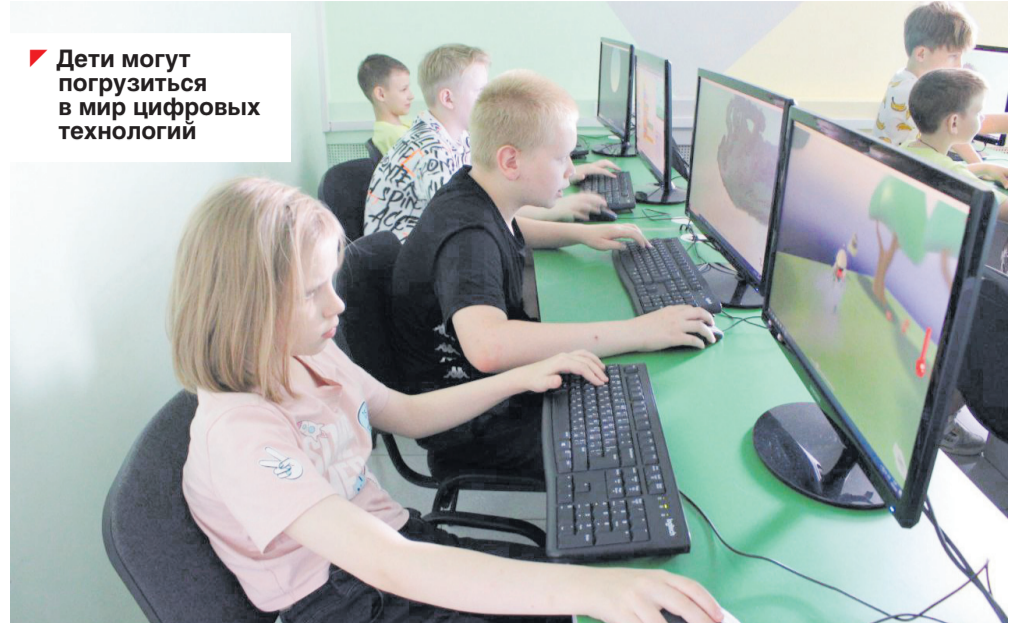
Дети могут погрузиться в мир цифровых технологий

Погода в этом летнем сезоне не подвела. Купаться можно практически еже-