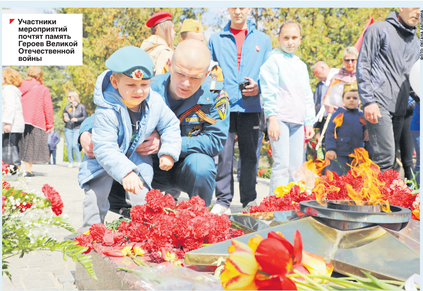
Участники мероприятий почтят память Героев Великой Отечественной войны